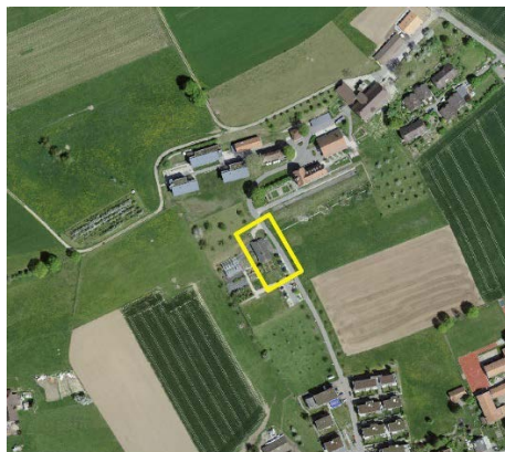
► Lage Gebäude Südhang 12 – ZöN A

Die Realisierung der Kita in der Liegenschaft Südhang 12 ist in der bestehenden Wohnung vorgesehen. Wesentliche bauliche Anpassungen sind innerhalb dieser Wohnung für die Nutzung der Tagesstätte nicht erforderlich. Zur Sicherstellung der erforderlichen Sicherheitsvorschriften müssen insbesondere im Ausenbereich nötige Absperrungen, Erhöhungen von Brüstungen, Anpassungen bei Treppenaufgängen realisiert werden und der Garten mit entsprechenden Spielgeräte ausgestattet werden.